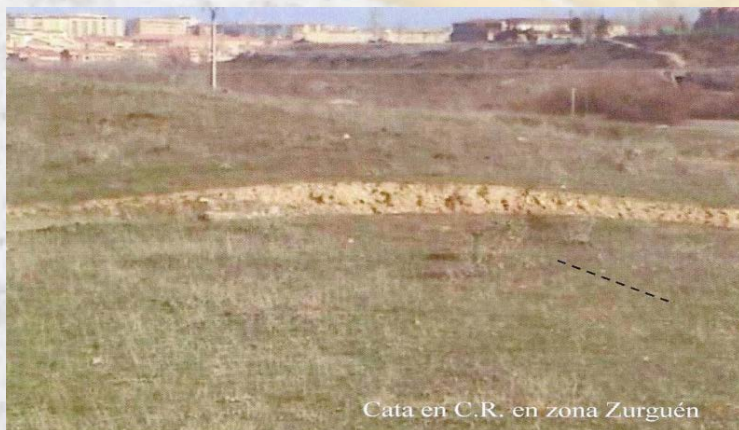
Cata en C.R. en zona Zurguén