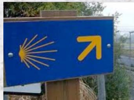
La señalización con flechas amarillas y placas