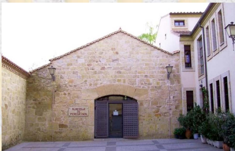
Albergue de peregrinos de Salamanca