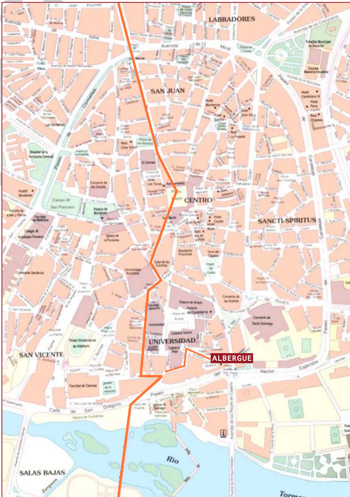
L a Via de la Plata a su paso por Ciudad de Salamanca (Camino que siguen los peregrinos)

El camino de Santiago entra por la Carretera de Aldeatejada, sigue por el Puente Romano, Calle Tentenecio, Calle de Libreros, Calle Compañía, Calle Meléndez, Plaza del Corriño, Plaza Mayor, Calle de Zamora, Avda. de Torres Villarroel y Carretera de Zamora. De ahí se dirige hacia Aldeaseca de la Armuña.